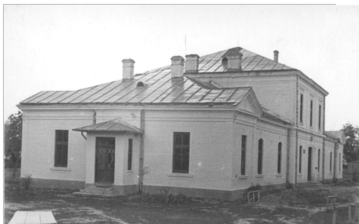
Pavilionul B4. Inițial a adăpostit secția de boli dermatologice și sifilis, temporar și serviciile ORL și boli contagioase. În prezent aici funcționează secția clinică de chirurgie.