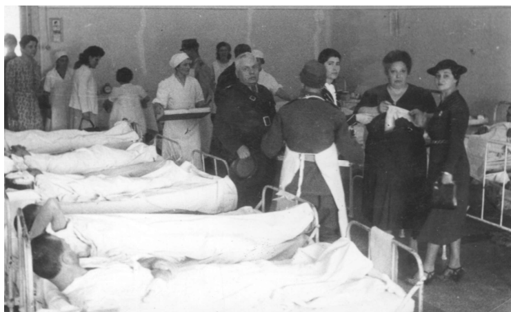
Salon cu răniți

În primul război mondial spitalul a fost evacuat la Galați, Botoșani, Tg. Frumos și Bacău. În locul său, pe timpul ocupației germane, au fost instalate magazii pentru materiale. Revine pe amplasamentul din Craiova în 1919. Tot personalul existent a fost angrenat în crâncenele înclucștări din Moldova, plătind tribut și în oameni, cea mai importantă pierdere fiind cea a medicului colonel Ion Butză, ajuns între timp șeful serviciului sanitar de la Marele Cartier General.