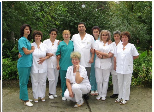
Colectivul compartimentului Pneumologie