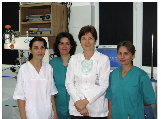
Colectivul compartimentului Oftalmologie