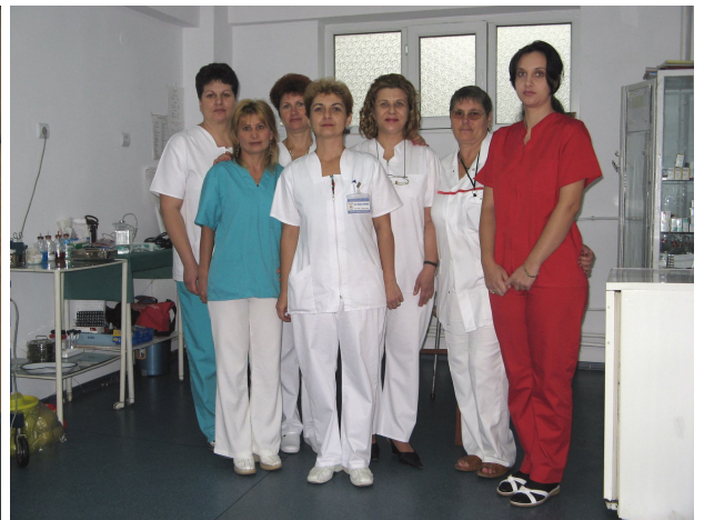
Colectivul Unității de Primire Urgențe