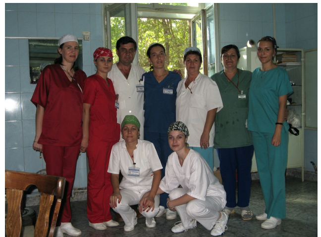
Colectivul secţiei clinice Chirurgie