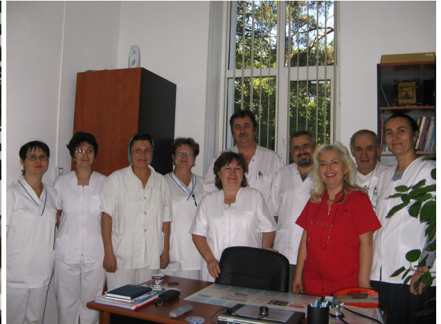
Colectivul de medici şi asistente al secţiei Medicină internă