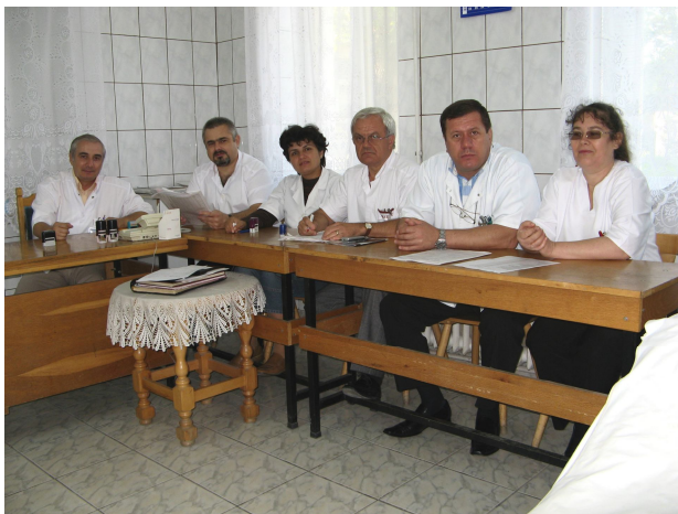
Comisia de expertiză medico-militară