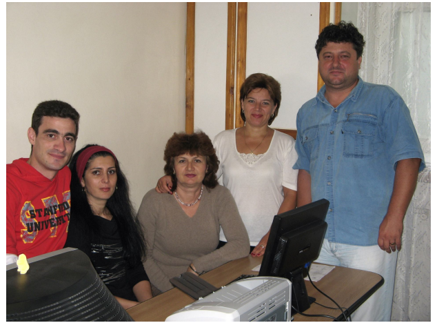
Personal din administratia spitalului