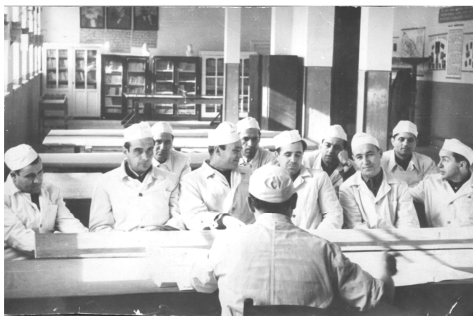
Ședință științifică - 1965

În perioada 1951-1960 în spital se creează o imagine de