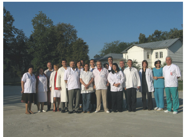
Colectivul de medici și asistente șefe al Spitalului Clinic de Urgență Militar „ Dr. Ștefan Odobleja” Craiova