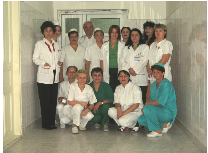
Colectivul secției Psihiatrie și al compartimentului Neurologie