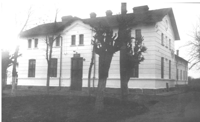
Pavilionul secției medicină internă, construit în 1885, demolat complet în 1990. Pe amplasamentul său s-a construit pavilionul D, ocupat în prezent de Ambulatoriul de specialitate, comanda și administrația spitalului

Capacitatea spitalului era în anul 1938 de 377 paturi.