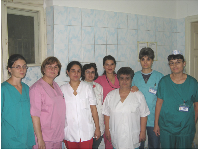
Colectivul compartimentului ATI