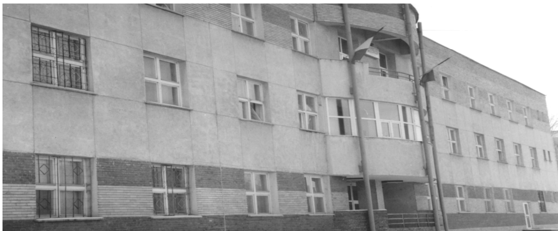
Actualul pavilion D, dat în folosință în 1996, destinat comenzii și administrației spitalului, ambulatoriului de specialitate, stomatologiei, radiologiei, farmaciei.

pneumoftiziologie ce a ocupat începând din anul 1990 o parte din parterul pavilionului B1 și între anii 1992-2000 a funcționat ca secție exterioară la Spitalul nr.3 Craiova.