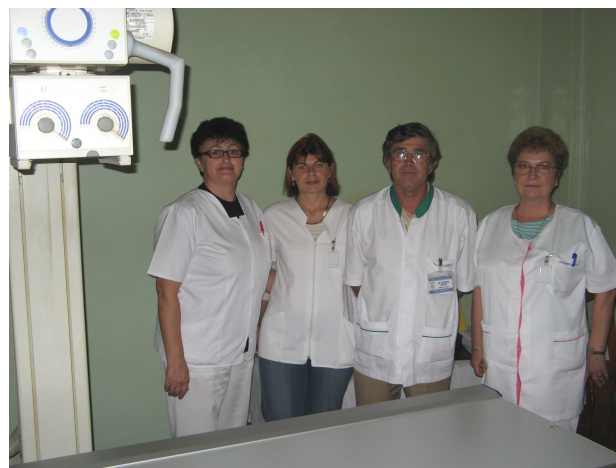
Colectivul secției Radiologie