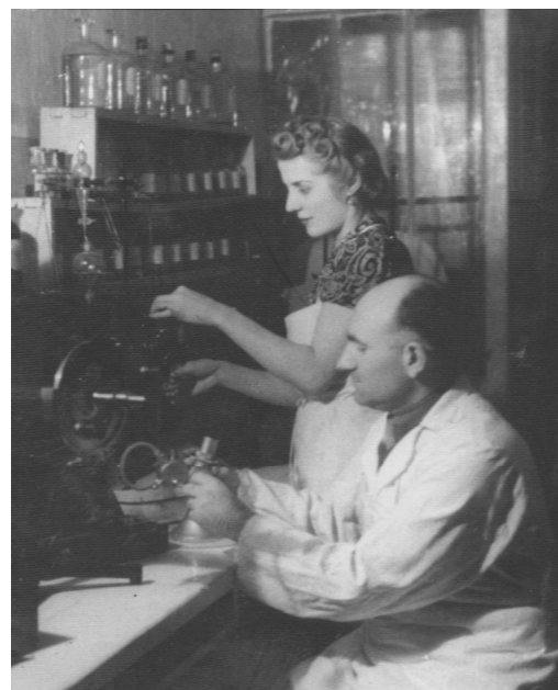
Laboratorul de chimie