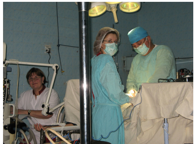
Secţia clinică Chirurgie - sala de operaţii