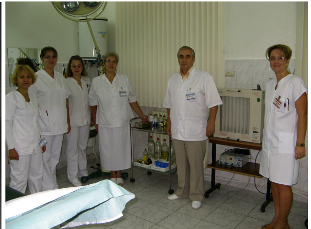
Colectivul compartimentului Dermato-venerologie