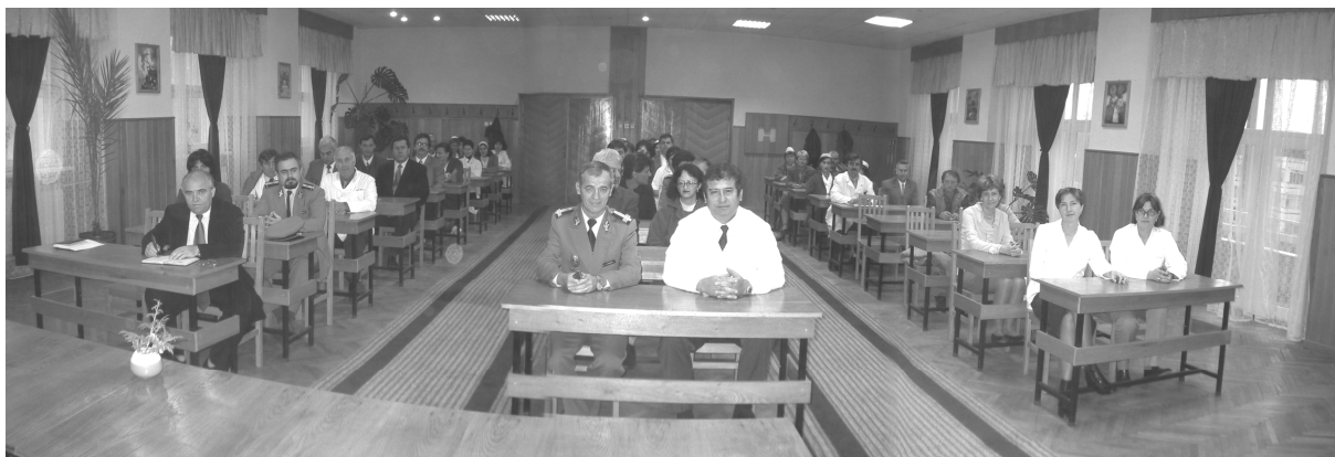
Colectivul Spitalului Militar de Urgență „Dr. Ștefan Odoobleja” în 2002 – raport de gardă

În perioada 16-18 oct. 2002 s-au organizat Zilele Spitalului Militar de Urgență „Dr. Ștefan Odoobleja” și Simpozionul – 100 de ani de la nașterea lui Ștefan Odoobleja .