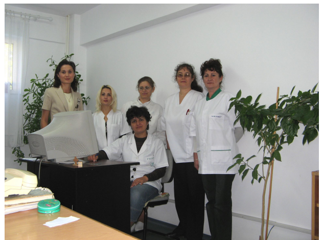
Colectivul secției Registratură și statistică medicală