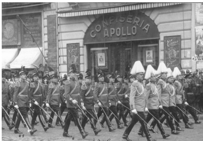
Defilarea ofițerilor în garnizoana Craiova

Prin Regulamentele Ostășești elaborate în iulie 1831 se hotărăște ca asigurarea medicală a regimentelor înființate să se facă prin 3 lazarete și anume la București, Craiova și Ploiești.