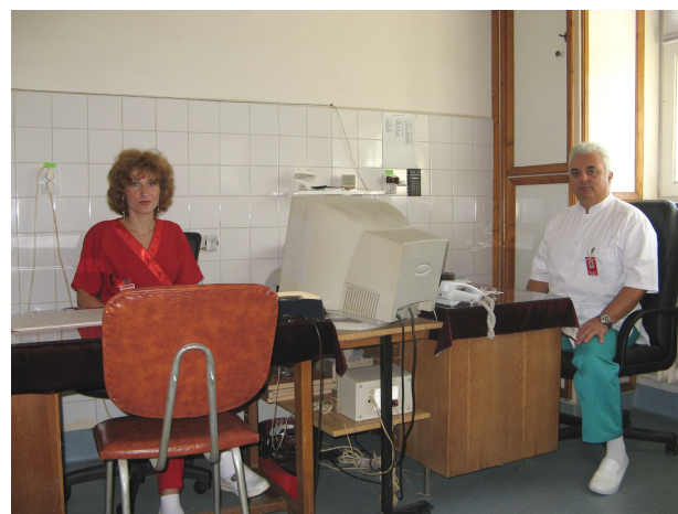
Dr. Călin Cătălin Ambulatoriul de specialitate Cabinet ginecologie