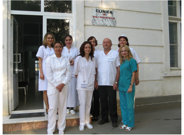
Colectivul secției Boli infecțioase