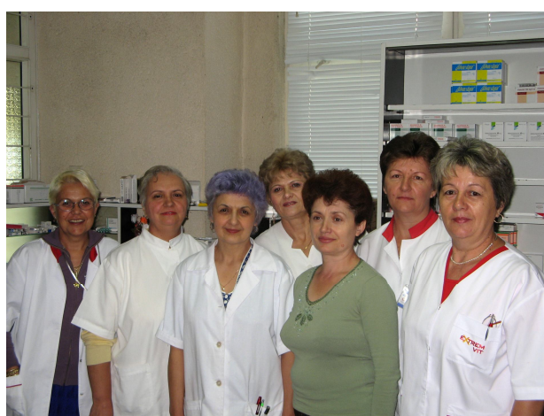
Colectivul secției Farmacie