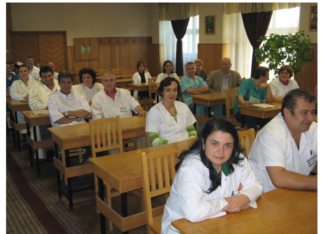
Aspecte de la raportul de gardă pe spital