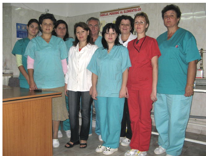
Colectivul laboratorului de analize medicale