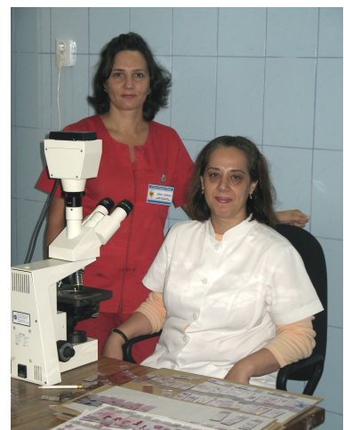
Colectivul Laboratorului de anatomie patologică