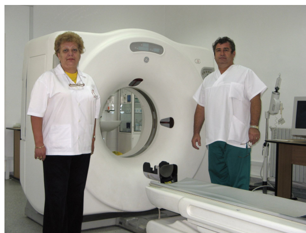
Laborator tomografie computerizată