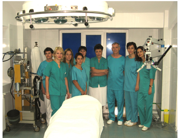
Colectivul compartimentului O.R.L.